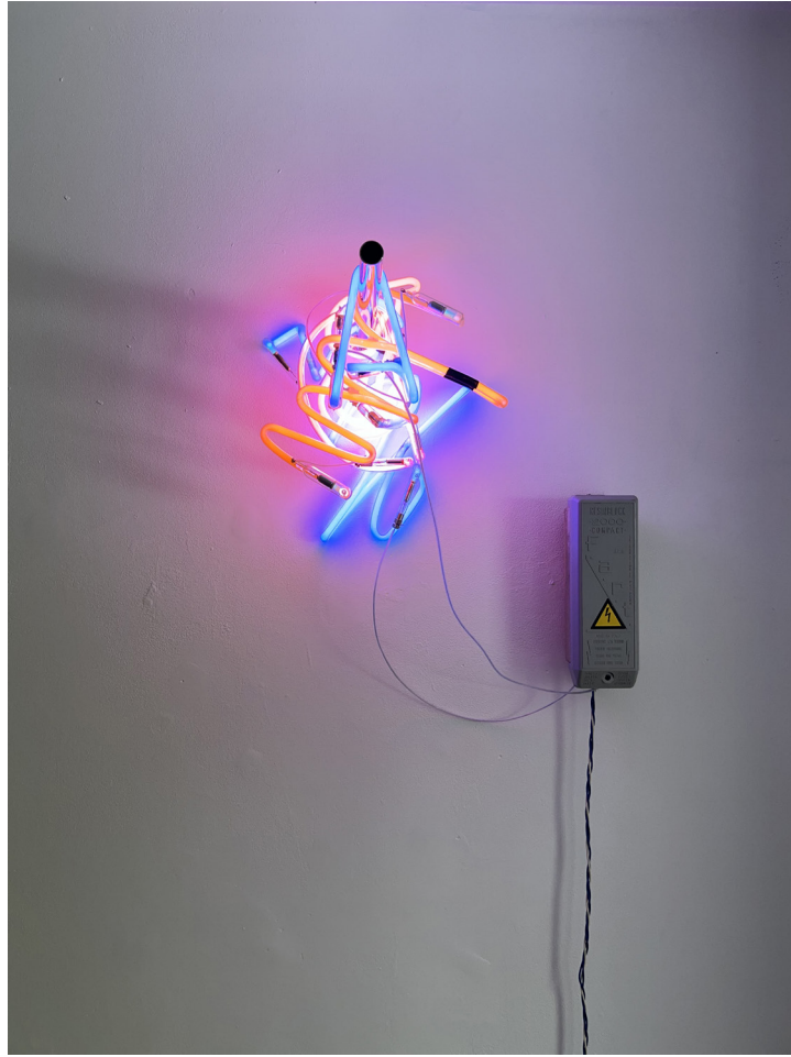
Petit rack, 2024 tube néon; transformateur électrique, tige inox, 30 x 20 cm.