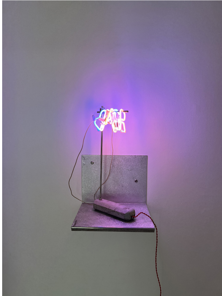
Mini rack à néon, 2024 tube néon; transformateur électrique, tige inox, 40 x 25 cm.