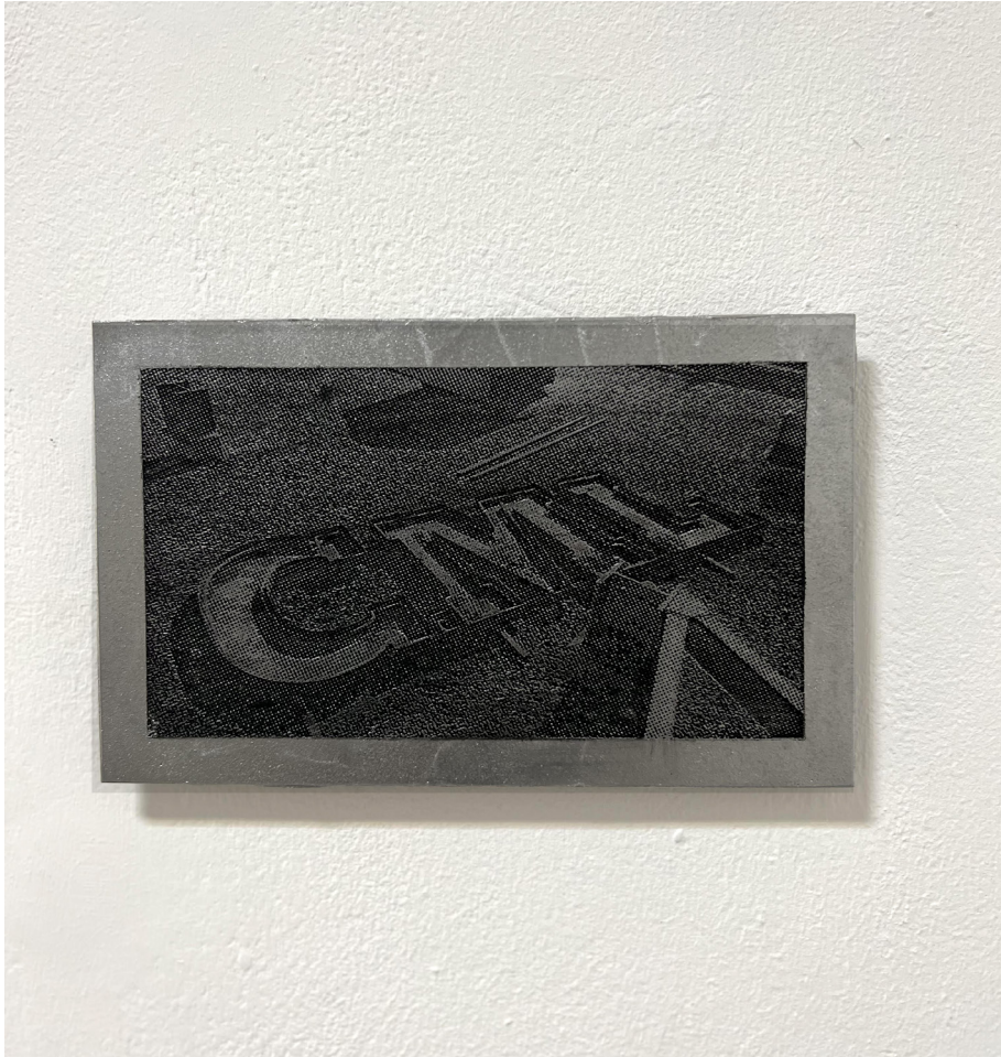
CML déchue, 2023 fonderie aluminium et encre, 14 x 22,5 cm.